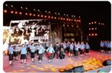
礼赞二十大活动《建党百年 青春礼赞》