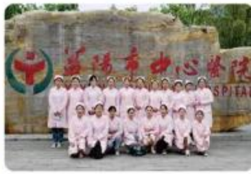
在益阳市中心医院实习学生