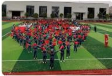
艺体节活动《红心永向党》