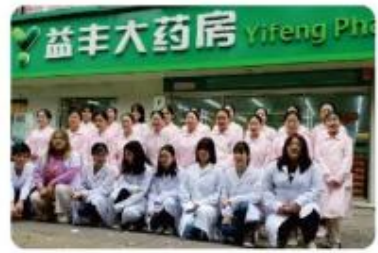
在益丰大药房实习学生