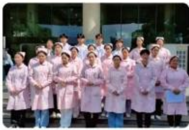
在长沙市中医医院实习学生